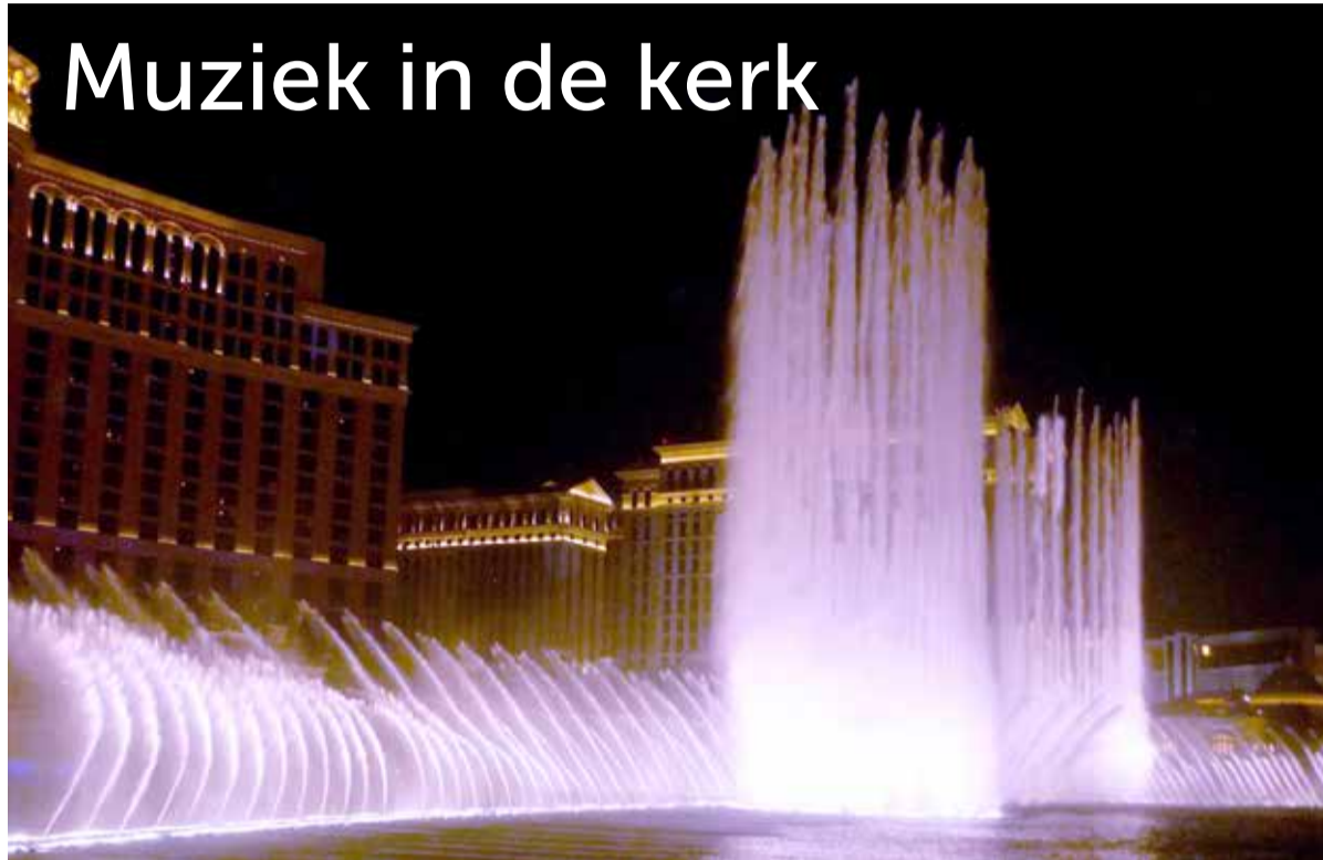
'Muziek is een universele taal.' Beeld: waterorgel in Las Vegas.